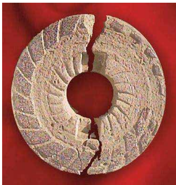
Græsk SYMBOLON i form af en lille lerskive, der blev brækket i to halvdele

Så langt så godt, men det er også nødvendigt at afsøge sammenhængen mellem astrologi og astronomi, der handler om to meget forskellige ting, og derfor tilsyneladende udelukker hinanden. Astronomi er en naturvidenskab, der bygger på målinger og beregninger, mens astrologi er en (kommende) humanvidenskab, der bygger